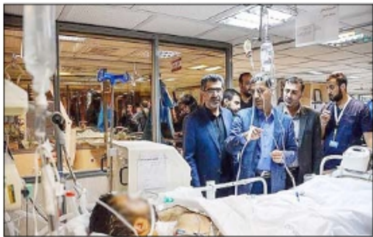
مجرورین حمله تروریستی شاهچراغ در بیمارستان نمازی شیراز - تسنیم