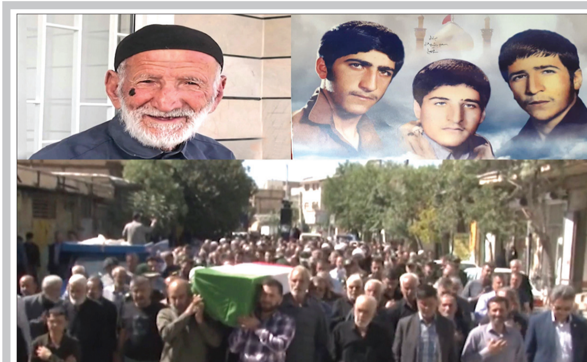
پیکر پدر شهیدان «عسگری» در جوار فرزندان شهیدش آرام گرفت

حمله نظامی روسیه به اوکراین، در پنجم اسفند ۱۴۰۰، شرایط امنیتی سیاسی جهان را وارد مرحله جدیدی کرد و معادلات صلح در سطح بین‌المللی را آنچنان به هم ریخت که به اذعان بسیاری از کارشناسان، بازگشت به شرایط قبل از آن، تقریباً ناشدنی است بوتین با تکیه بر جاه طلبی، ثبات اقتصادی نسبی در دوره حاکمیتش، طرح شعارهای ملی‌گرایانه و سیاست‌های دنبال‌کننده ایده بازبایی اقتدار گذشته، «کشور» واقعی نمی‌دانست. این منحصر به بوتین نبوده و بسیاری از روس‌های ملی‌گرا دلیلی برای استقلال اوکراین نمی‌بینند بوتین از ابتدا نگاه تحقیرآمیز گرفته باشد یک اقدام غیر قانونی، غیر انسانی و ظالمانه در حق ملت اوکراین است و ناقض آشکار منشورهای سازمان ملل، و مقررات و قوانین مورد اجماع جامعه جهانی است